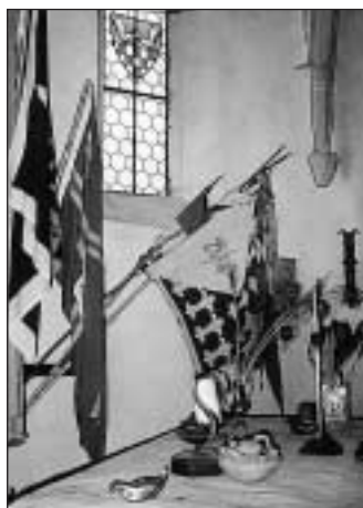
Flaggen verschiedener Bünden in der Kapelle der Jugendburg.

Ein Gespräch zu diesem Jubiläum findet im Oktober auf Initiative unserer Gilde im IPG statt. Selbstverständlich ist die Zusammenarbeit mit der Burggemeinschaft und den Verantwortlichen des IPG abgesprochen und bereits zugesagt. Die Einladungen sind zum Teil bereits abgeschickt. Nur geladene Gäste! Trotzdem suchen wir noch ehemalige Führer und Exponenten der damaligen „Grauen Division“, die über das veraltete Adressenmaterial nicht mehr erfaßt werden können.