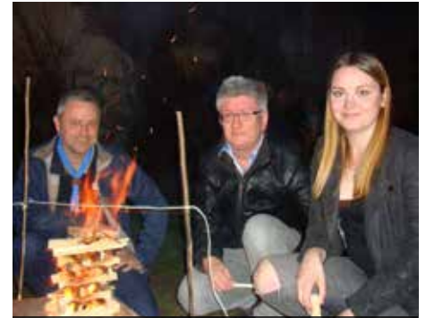
Teil des Wettbewerbes: Feuermachen

vorzeigbare Leistungen beim Holzhacken, Feuermachen, Knoten- und Bündemachen und beim