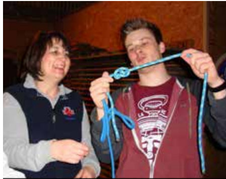
Wenn die neuen Mitglieder fürs Programm zuständig sind

Alles war bestens vorbereitet und durchorganisiert. Wir verbrachten einen lustigen und interessanten Abend und fühlten uns zurückversetzt in unsere Jugend. Natürlich gaben wir bei den Wettbewerben unser Bestes und erbrachten