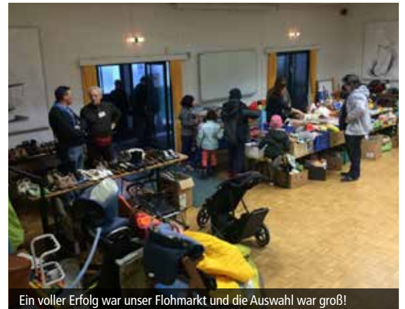
Ein voller Erfolg war unser Flohmarkt und die Auswahl war groß!