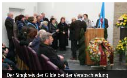
Der Singkreis der Gilde bei der Verabschiedung