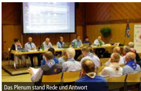
Das Plenum stand Rede und Antwort