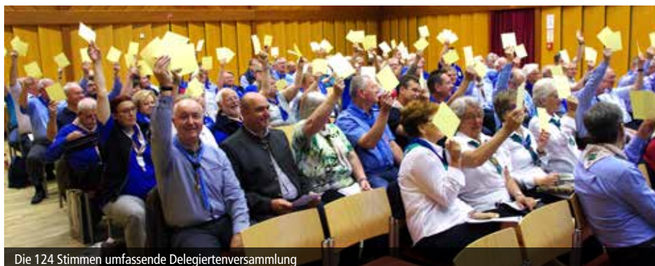
Die 124 Stimmen umfassende Delegiertenversammlung