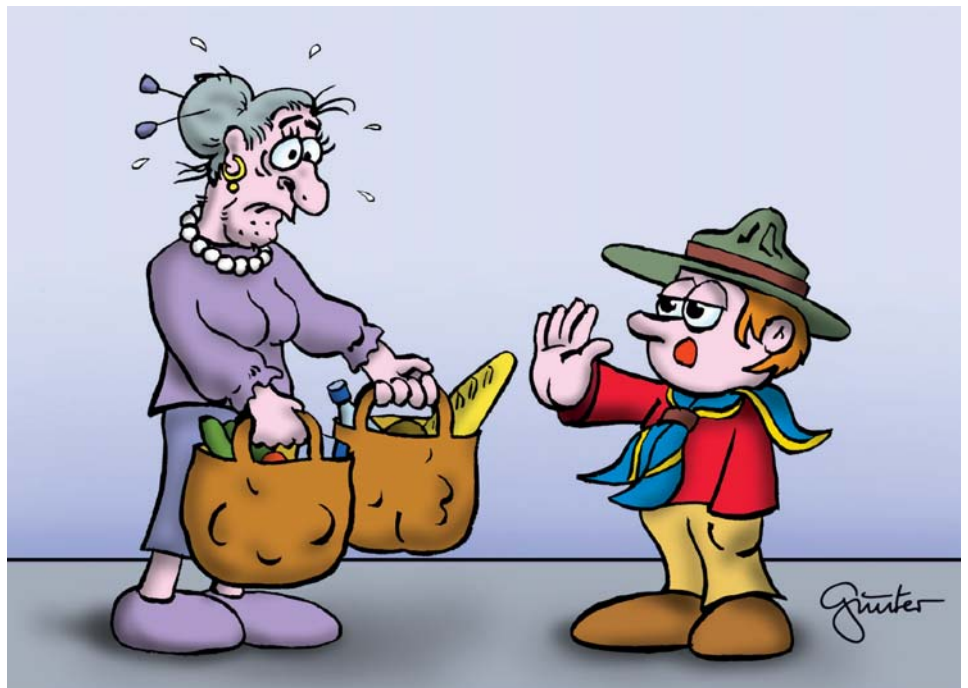
Cartoon von Günter Reichenpfader