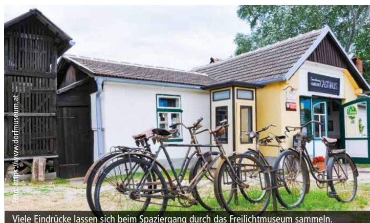
Viele Eindrücke lassen sich beim Spaziergang durch das Freilichtmuseum sammeln.