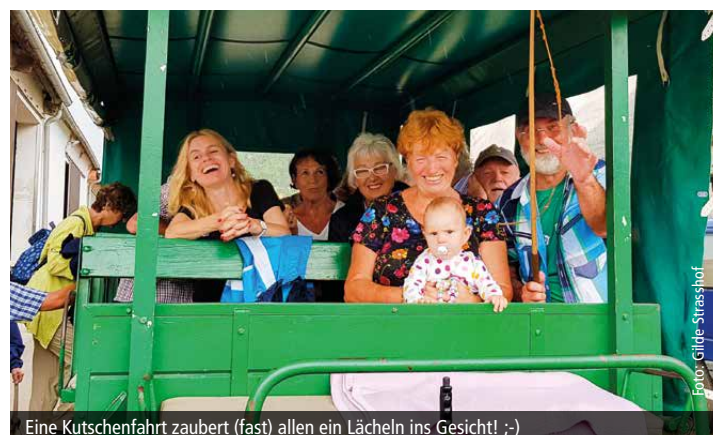
Eine Kutschenfahrt zaubert (fast) allen ein Lächeln ins Gesicht! ;-)