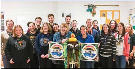
Badener Leiterinnen und Leiter sowie Mitarbeiterinnen und Mitarbeiter haben sich vergangenes Jahr der Challenge des iScout Games gestellt – und sie tun es wieder!

Wenn ihr den Großteil der oben genannten Punkte, allen voran den der Englischkenntnisse, mit ja beantworten könnt, dann ist das iScout Game für euch genau richtig!