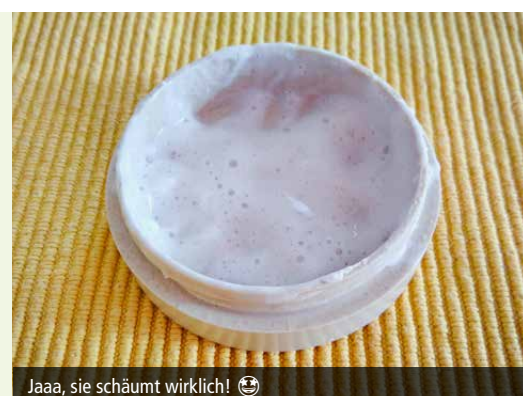
Jaaa, sie schäumt wirklich!

Im Vergleich zu normaler Seife ist Kernseife in der Regel frei von überschüssigem Fett, Duft- und Zusatzstoffen und ist daher für Allergiker*innen gut verträglich.