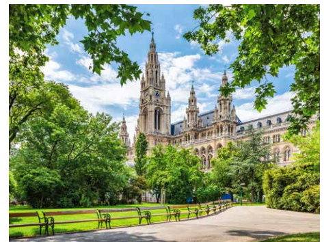
Das Wiener Rathaus aus Sicht des Gedenksteins